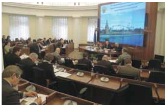
Заседание рабочей группы по подготовке предложений по реализации программы увековечения памяти жертв политических репрессий

В начале 2011 г. члены Совета большинством голосов (34 из 40, см. Приложение 129) поддержали Предложения, подготовленные рабочей группой. Предложения были представлены Президенту РФ Д.А. Медведеву на встрече в Екатеринбурге 1 февраля 2011 г. Результатом стало создание межведомственной рабочей группы по подготовке предложений, направленных на реализацию программы увековечения памяти жертв политических репрессий, образованной Распоряжением Президента РФ от 27.12.2011 № 819-рп (Приложение 130).