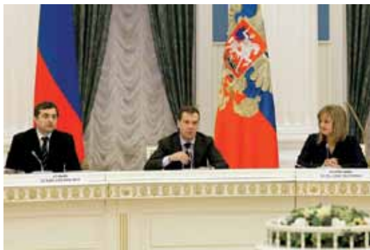
В.Ю. Сурков, Д.А. Медведев и Э.А. Памфилова

Главой государства были даны поручения и указания по всем переданным ему материалам ( Приложение 101 ).