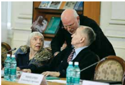
Л.М. Алексеева, М.А. Федотов и С.С. Алексеев