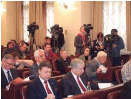
Специальное заседание Совета 10 апреля 2012 г.

По результатам заседания были выработаны Рекомендации Совета (Приложение 119), которые были направлены всем заинтересованным министерствам, ведомствам и общественным организациям, а также доложены Президенту РФ.