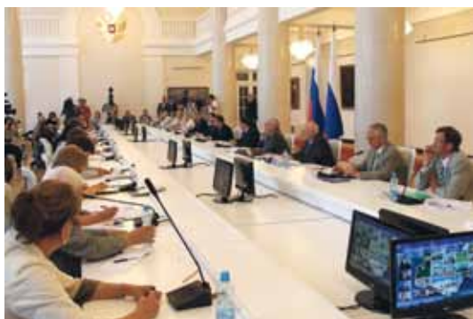
Заседание Совета в Нальчике 5 июля 2011 г.

Президент РФ Д.А. Медведев на встрече с Советом 05.07.2011