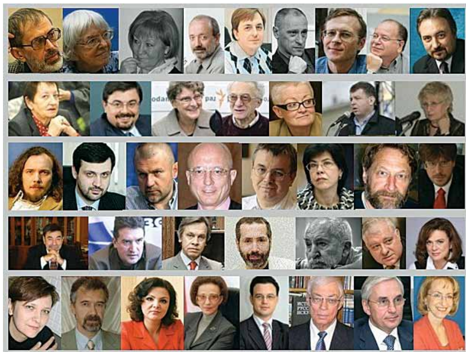
Члены Совета, состав 2011–2012 гг.