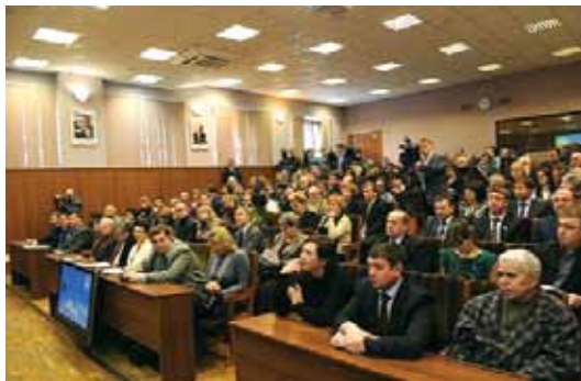
Пленарное заседание в Екатеринбурге

Всего в работе секций приняли участие 119 человек (не считая членов Совета), в том числе десять докторов наук и восемь кандидатов наук. Шло активное обсуждение вопросов, включенных в повестку работы секций: за время, отведенное на их работу, успело выступить более 70 человек. По окончании работы все участники форума отметили высокую продуктивность такого формата совместной работы и выразили общую готовность к продолжению сотрудничества.