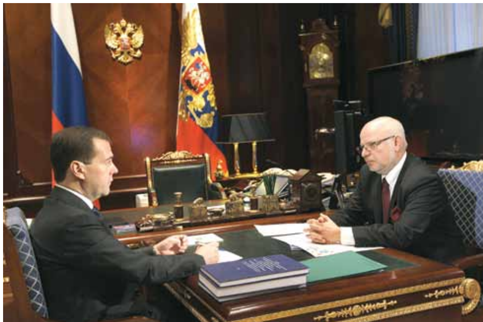
Д.А. Медведев и М.А. Федотов. 27 декабря 2011 г.

2 февраля 2012 г. — в пресс-центре ИА «Интерфакс» состоялась пресс-конференция членов Совета под председательством М.А. Федотова, на которой были представлены и переданы представителям прессы законопроекты, разработанные в целях реализации общих рекомендаций Совета по результатам общественного научного анализа уголовного дела М.Б. Ходорковского и П.Л. Лебедева, а также проекты постановления об амнистии по делам о ненасильственных преступлениях и поступившие в Совет поддержанные представителями общественности предложения о помиловании ряда осужденных ( Приложение 181 ).