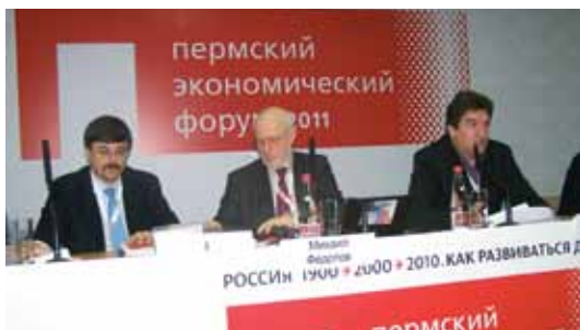
Пленарное заседание Совета в Перми

По результатам обсуждения проекта программы «Об увековечении памяти жертв тоталитарного режима и о национальном примирении» были сформулированы конкретные предложения по ее реализации. Материалы заседания по иным вопросам были переданы для дальнейшей проработки в соответствующие рабочие группы Совета.