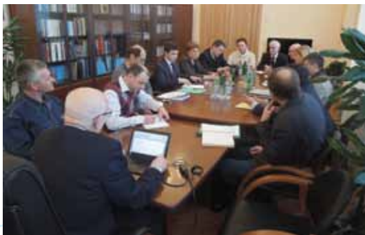
Заседание рабочей группы

Президент РФ Д.А. Медведев на встрече с Советом 15.03.2012