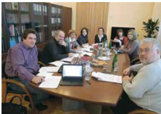
Заседание рабочей группы

Президент РФ Д.А. Медведев на встрече с Советом 05.07.2011