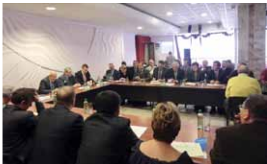
Работа секции 2 в Белокурихе