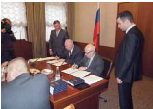
М.А. Федотов и А.И. Бастрыкин подписывают Положение о взаимодействии между Советом и СК РФ

Члены Совета передали представителям Следственного комитета и Генеральной прокуратуры РФ самостоятельно собранные ими материалы по уголовным делам, которые в случае бездействия правоохранительных органов могут закончиться трагически. По результатам заседания Совет создал рабочие группы по сотрудничеству в расследовании так называемого дела С.Л. Магнитского со Следственным департаментом МВД России и Следственным комитетом РФ, а также с Генеральной прокуратурой РФ.