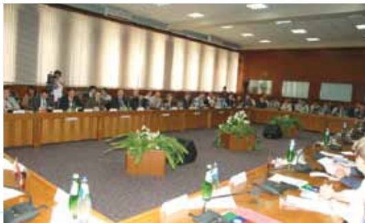
Заседание Совета в Махачкале