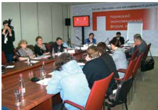
Заседание экспертной секции в Перми