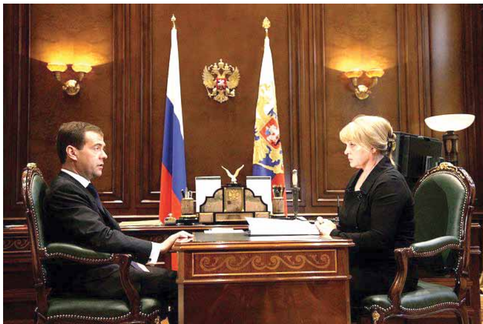
Д.А. Медведев и Э.А. Памфилова. 30 марта 2010 г.

30 марта 2010 г. — председатель Совета Э.А. Памфилова на встрече с Президентом РФ передала Д.А. Медведеву обращение представителей общественных организаций и деятелей культуры Санкт-Петербурга с просьбой о приостановлении работ по строительству 400-метрового небоскреба «Охта-центр». 21 мая 2010 г. помощник Президента РФ С.Э. Приходько направил письмо губернатору Санкт-Петербурга В.И. Матвиенко с просьбой приостановить все работы по проекту и рассмотреть альтернативные варианты строительства.