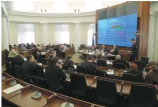
Заседание Совета 13 февраля 2012 г.

В заседании приняли участие Уполномоченный по правам человека в РФ В.П. Лукин, член Коллегии Министерства внутренних дел РФ генерал-лейтенант полиции Ю.Н. Демидов, представители ФСИН России, Минюста России, Генеральной прокуратуры РФ, Общественной палаты РФ и Общественного совета при ФСИН России, члены общественных наблюдательных комиссий из различных регионов страны, эксперты заинтересованных общественных организаций.