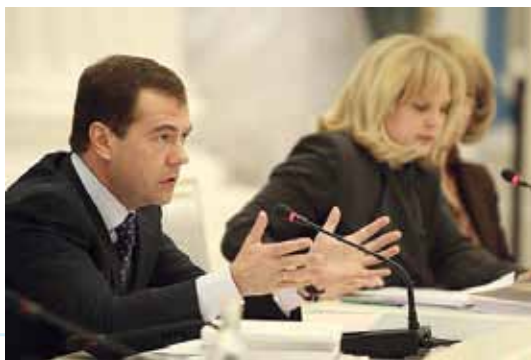
Д.А. Медведев и Э.А. Памфилова на заседании

Президент РФ Д.А. Медведев на встрече с Советом 15.04.2009