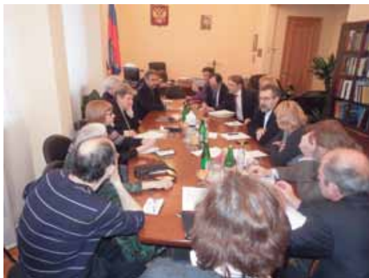
Заседание рабочей группы

Рабочей группой были инициированы и разработаны Заявление Совета о недопустимости использования административного ресурса в ходе избирательной кампании ( Приложение 165 ), Заявление Совета в поддержку работы обществен-