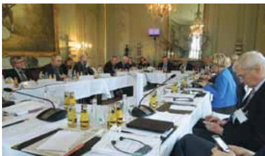
Конференция дискуссионного клуба «Грюневальд». Берлин, 30 марта 2012 г.

Председатель Совета М.А. Федотов и член Совета С.А. Караганов — постоянные участники ежегодных конференций клуба «Грюневальд», в рамках которых они выступают с докладами по различным аспектам сотрудничества России и ЕС.