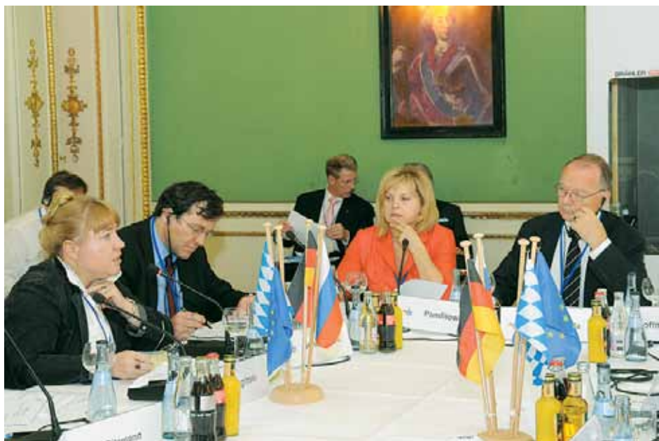
Э.А. Памфилова на заседании группы «Гражданское общество» в Мюнхене 15 июля 2009 г.

28 июля 2009 г. — состоялось очередное заседание Совета, на котором впервые прозвучало предложение поставить перед Президентом РФ вопрос о создании общественного телерадиовещания, а также об усилении уголовной ответственности за «совершение преступления в отношении лица или его близких в связи с осуществ-