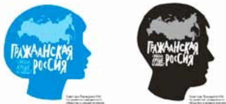
Логотип Программы «Гражданская Россия»

Исходя из этих и иных предпосылок, задачи Программы «Гражданская Россия» были определены как содействие развитию структур гражданского общества в России, вовлечение НКО, добровольцев и гражданских активистов в многогранную деятельность по модернизации страны. В рамках Программы проводились выездные и специальные заседания Совета и его рабочих групп, которые, несомненно, стимулировали гражданскую активность в российских регионах и содействовали