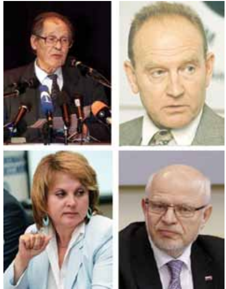
Председатели Комиссии/Совета: (верхний ряд) С.А. Ковалев, В.А. Карташкин, (нижний ряд) Э.А. Памфилова, М.А. Федотов

Совет ведет свою историю с 1 ноября 1993 г., когда указом первого Президента России Бориса Ельцина была образована Комиссия по правам человека при Президенте РФ. В 1993–1995 гг. ее возглавлял известный правозащитник Сергей Ковалев, в 1996–2002 гг. — видный специалист в области международного права Владимир Карташкин. На основании Указа Президента РФ от 06.11.2004 № 1417 Комиссия была преобразована в Совет при Президенте РФ по содействию развитию институтов гражданского общества и правам человека. С 2002 по 2010 г. Комиссию, а затем Совет возглавляла видный общественный и государственный деятель Элла Памфилова. Указом Президента РФ от 12.10.2010 № 1234 председателем Совета назначен Михаил Федотов.