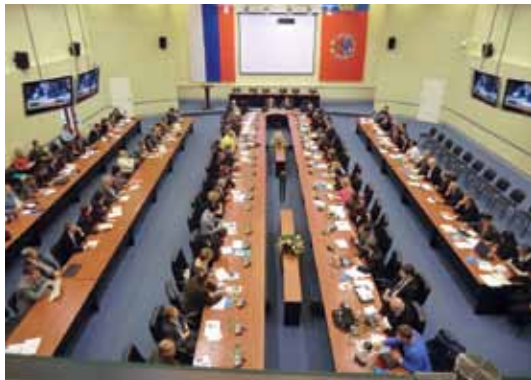
Пленарное заседание в Белокурихе