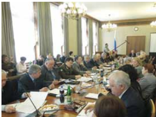
Заседание Совета 27 марта 2012 г.