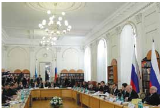
Заседание Совета в Екатеринбурге

Президент РФ Д.А. Медведев на встрече с Советом 01.02.2011