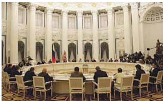
Заседание Совета 23 ноября 2009 г.

Президент РФ Д.А. Медведев на встрече с Советом 23.11.2009