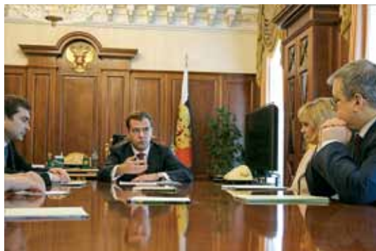
Президент РФ Д.А. Медведев обсуждает планы рабочей группы по развитию НКО с В.Ю. Сурковым, Э.А. Памфиловой и Я.И. Кузьминовым

Создана весной 2009 г., в том числе для подготовки заседаний межведомственной рабочей группы по совершенствованию законодательства РФ об НКО, в состав которой наряду с членами рабочей группы Совета по развитию НКО вошли представители Общественной палаты РФ, Федерального Собрания РФ, Администрации Президента РФ, Правительства РФ, профильных министерств и ведомств (в 2009–2011 гг. возглавлял В.Ю. Сурков). С просьбой создать такую РГ Совет обратился к