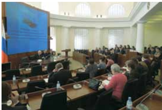
Заседание Совета 22 марта 2012 г.

По результатам прошедшего обсуждения были подготовлены и опубликованы Рекомендации Совета, направленные на укрепление гарантий прав человека в сфере миграции ( Приложение 117 ). Итоговый текст Рекомендаций был направлен Уполномоченному по правам человека в РФ, в ФМС России, Государственную Думу и Совет Федерации, в Общественную палату РФ, в другие организации, а также представлен главе государства.