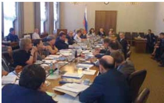
Специальное заседание Совета 23 мая 2011 г.

ственных организаций, корпорации «Росавтодор», подрядчиков строительства автотрассы Москва — Санкт-Петербург, частных охранных предприятий и др.