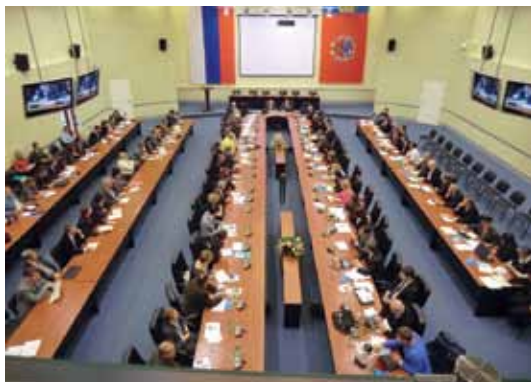
Пленарное заседание в Белокурихе