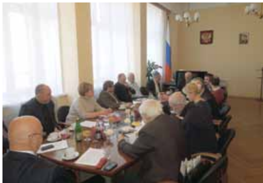
Заседание рабочей группы

ственного вещания в РФ и проект Федерального закона «Об общественном телевидении и радио», которые 27 декабря 2011 г. были представлены Президенту РФ Д.А. Медведеву ( Приложение 169 ). По поручению главы государства рабочая группа продолжила формирование различных вариантов создания в РФ системы общественного вещания. На совещании по вопросу создания общественного телевидения, которое проходило под