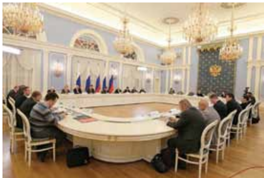
Заседание Совета в Горках

Президент РФ Д.А. Медведев на встрече с Советом 28.04.2012.