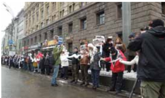
Акция «Белое кольцо» 26 февраля 2012 г.