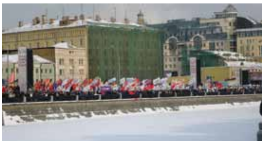
Митинг на Болотной площади 4 февраля 2012 г.