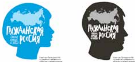
Логотип Программы «Гражданская Россия»

Исходя из этих и иных предпосылок, задачи Программы «Гражданская Россия» были определены как содействие развитию структур гражданского общества в России, вовлечение НКО, добровольцев и гражданских активистов в многогранную деятельность по модернизации страны. В рамках Программы проводились выездные и специальные заседания Совета и его рабочих групп, которые, несомненно, стимулировали гражданскую активность в российских регионах и содействовали повышению авторитета региональных общественных инициатив. Одновременно велась работа по формированию некоего плана действий по дальнейшему развитию гражданского