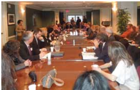
Российская делегация в институте Кеннана

Российская делегация познакомилась также с деятельностью Административного управления судов США – организации, обеспечивающей организационно-техническую поддержку работы судебной системы США. Визит завершился посещением Верховного суда США. Участники российской делегации почерпнули много полезного в части организации информационной открытости судов.