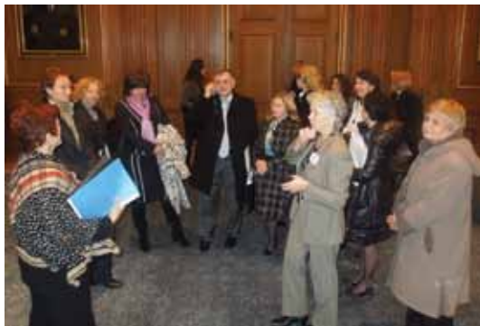
Российская делегация в Верховном суде США