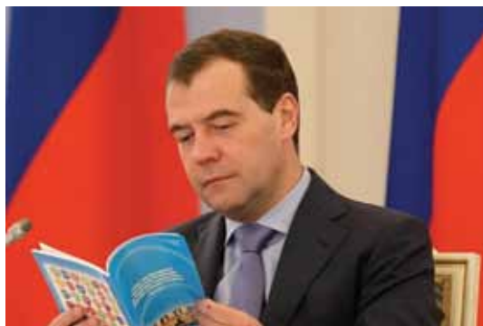
Д.А. Медведев держит в руках первый экземпляр брошюры