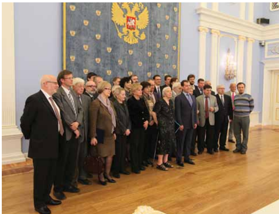
Совет при Президенте РФ по развитию гражданского общества и правам человека после встречи с Президентом РФ Д.А. Медведевым в Горках, 28 апреля 2012 г.

По каждому переданному документу Президентом РФ Д.А. Медведевым были даны указания ( Приложение 98 ). Кроме того, Президент утвердил перечень поручений по итогам встречи ( Приложение 99 ).