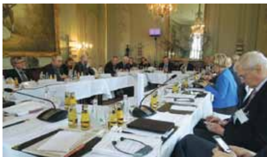
Конференция дискуссионного клуба «Грюневальд». Берлин, 30 марта 2012 г.

Совет активно сотрудничает с немецкими НКО, реализующими программы развития гражданского общества. Одной из таких НКО является Фонд Роберта Боша (Robert Bosch Stiftung), под патронатом которого организуются ежегодные конференции немецко-российско-польского дискуссионного клуба «Грюневальд».