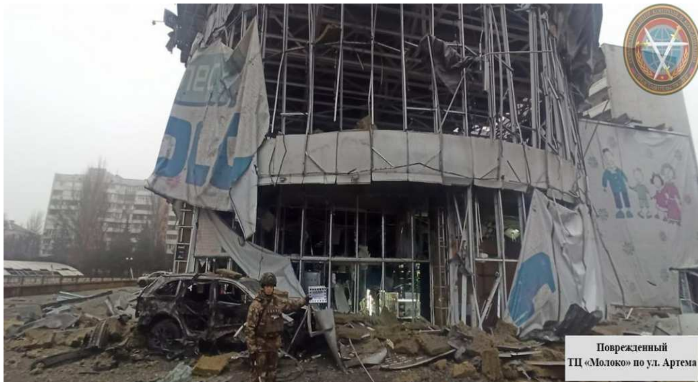
Поврежденный ТЦ «Молоко» по ул. Артема