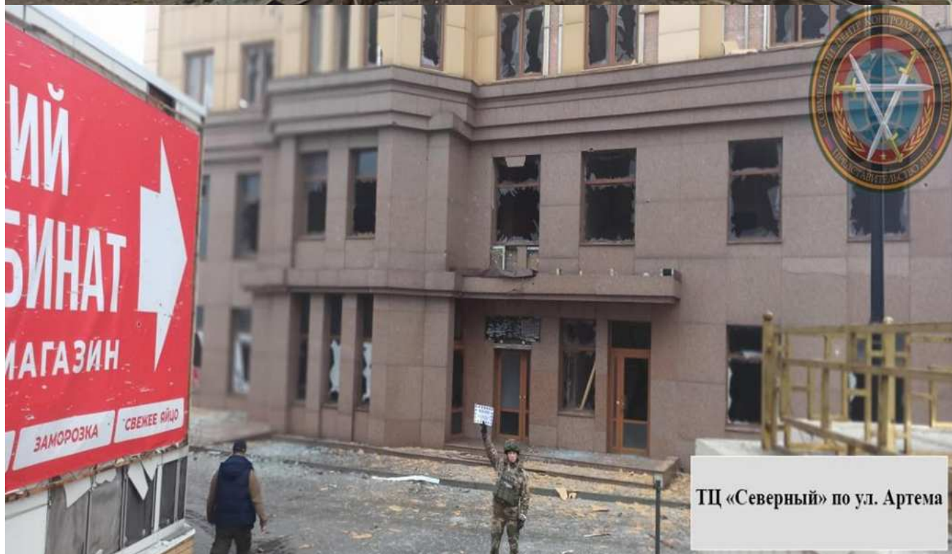
ТЦ «Северный» по ул. Артема

10.01.2025, в 08:45, украинские военные нанесли удар по Киевскому району Донецка с использованием РСЗО М142 HIMARS (М-270). Выпущено несколько осколочных ракет М31. В ходе атаки ранены две женщины, 1963 и 1940 г.р., сотрудник супермаркета «Молоко», 2002 г.р., и работник коммунального предприятия, 1968 г.р. Прямым попаданием разбит супермаркет «Геркулес-Молоко» (ул. Артема). Повреждены остекление и фасады аптеки «Сарепта» (ул. Артема) и торгового центра «Северный» (пр. Киевский)