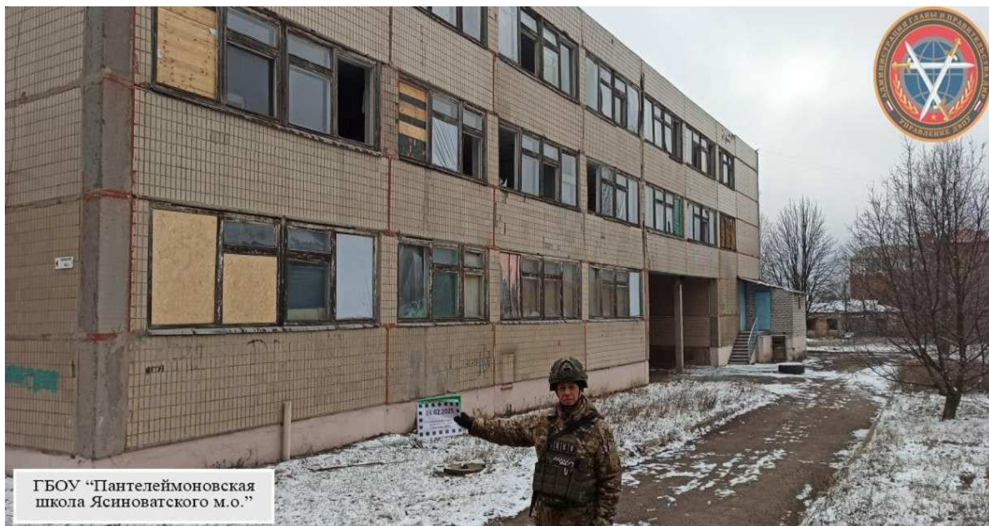
ГБОУ «Пантелеймоновская школа Ясиноватского м.о.»