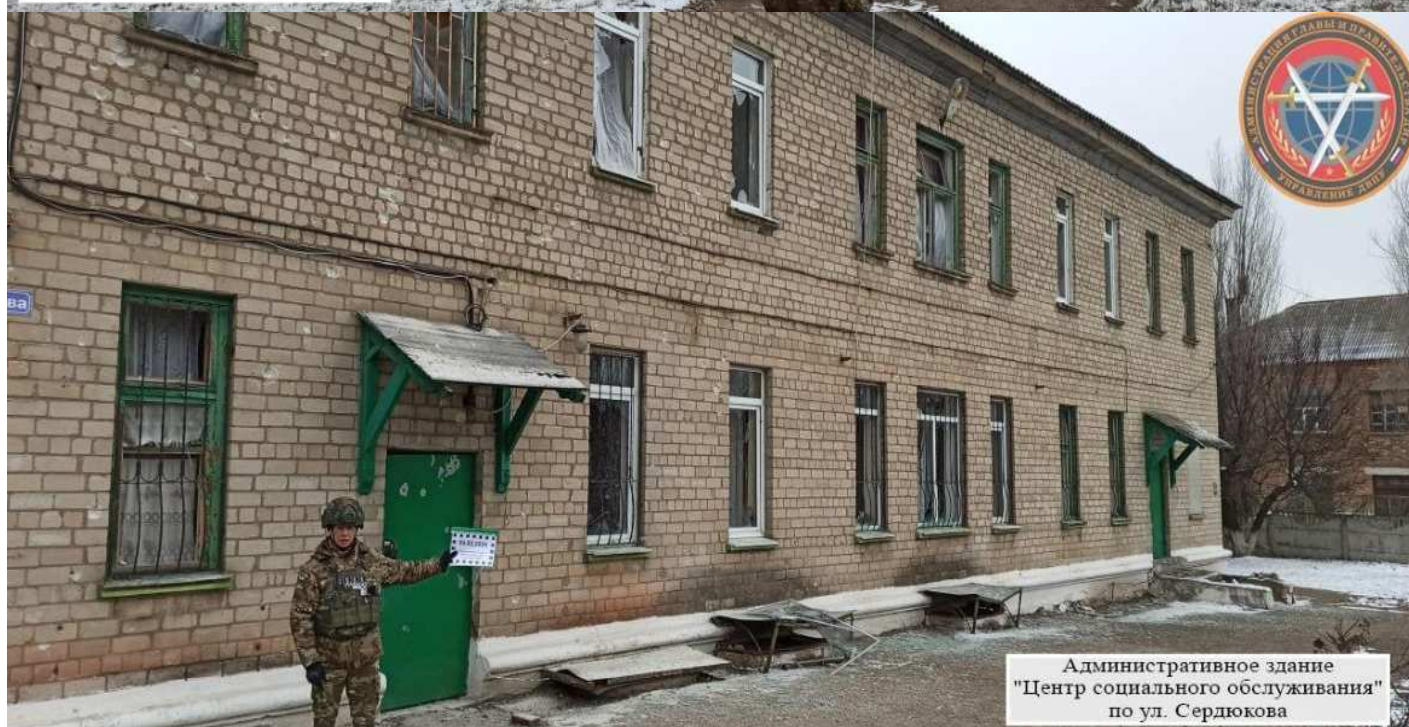
Административное здание "Центр социального обслуживания" по ул. Сердюкова

05.02.2025, в 15:50, удар Украины из РСЗО калибра 122 мм пришелся по жилым кварталам Пантелеймоновки (Ясиноватский район). В ходе бомбардировки пострадали Пантелеймоновская школа (ул. Сердюкова), Пантелеймоновский детский сад «Теремок» (ул. Парковая), здание местной жилищно-коммунальной компании (ул. Сердюкова), центр социального обслуживания населения (ул. Сердюкова) и три частных жилых дома (ул. Народная; ул. Парковая; ул. Первомайская)