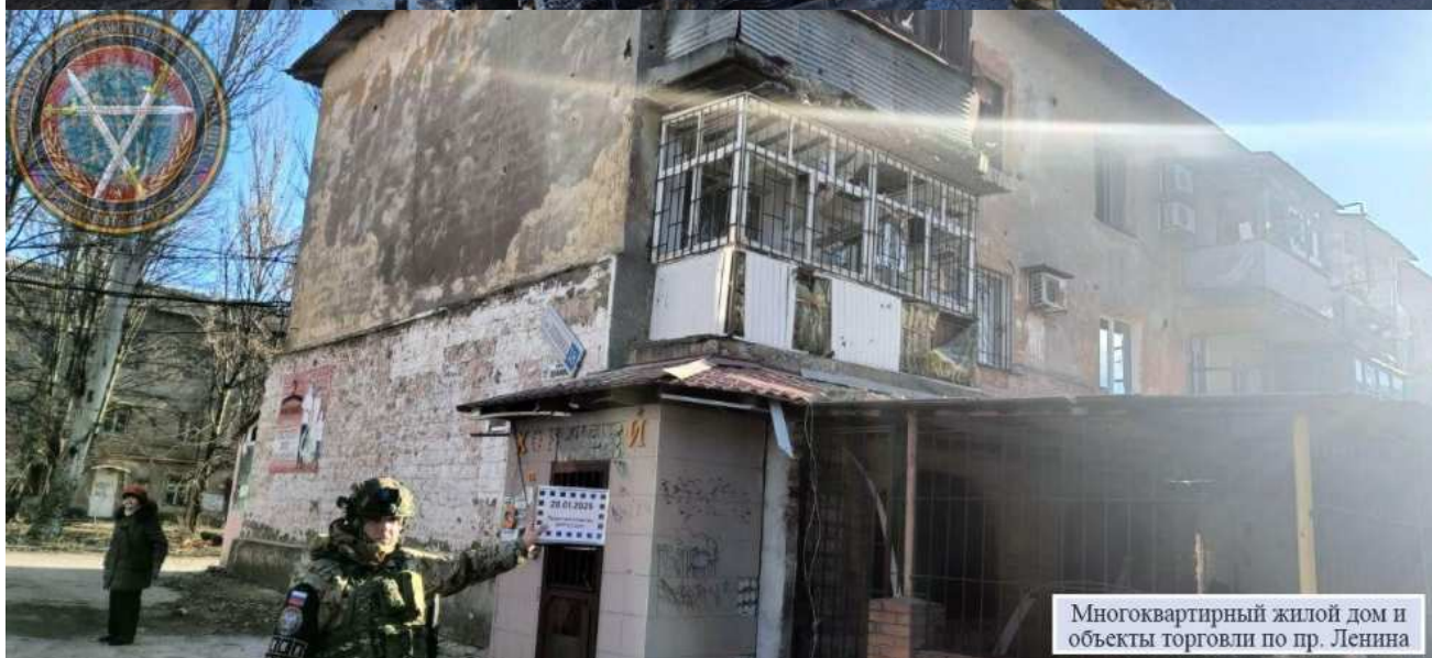
Многоквартирный жилой дом и объекты торговли по пр. Ленина

20.01.2025, в 08:45, украинские военные ударили по Центрально-Городскому району Горловки из ствольной артиллерии калибра 155 мм. В результате обстрела ранения различной степени тяжести получили одиннадцать мирных жителей: девять женщин, 1989, 1987, 1982, 1958, 1975, 1965, 1958, 1957 и 1947 г.р., и двое мужчин, 2000 и 1982 г.р. Пострадали Городская больница № 2 (пр. Ленина), дворец культуры «Шахтер» (пр. Ленина), предприятие «Вода Донбасса» (пр. Ленина), Горловский профессиональный техникум (пр. Ленина) и четыре многоквартирных дома (пр. Ленина). Кроме того, уничтожен автомобиль