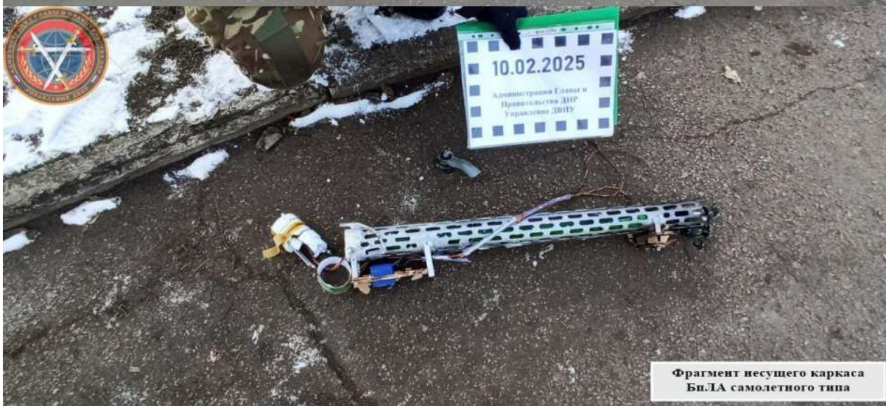
Фрагмент несущего каркаса Бп.ТА самолетного типа

09.02.2025, в 23:30, ударные БПЛА украинских вооруженных сил атаковали Киевский район Донецка. Разбиты остекление и фасады многоквартирного жилого дома, торговых павильонов и остановки общественного транспорта «Площадь Шахтерская» (ул. Артема). Кроме того, повреждены четыре легковых автомобиля и дорожное покрытие