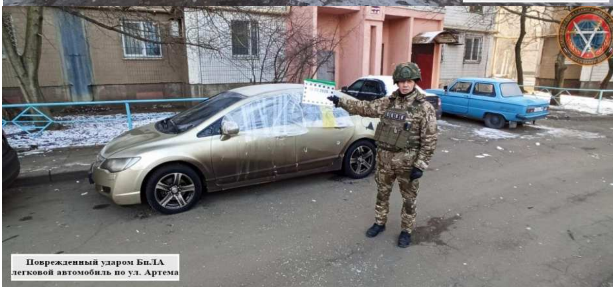
Поврежденный ударом Бп.ТА легковой автомобиль по ул. Артема