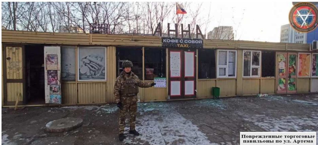
Поврежденные торговые павильоны по ул. Артема