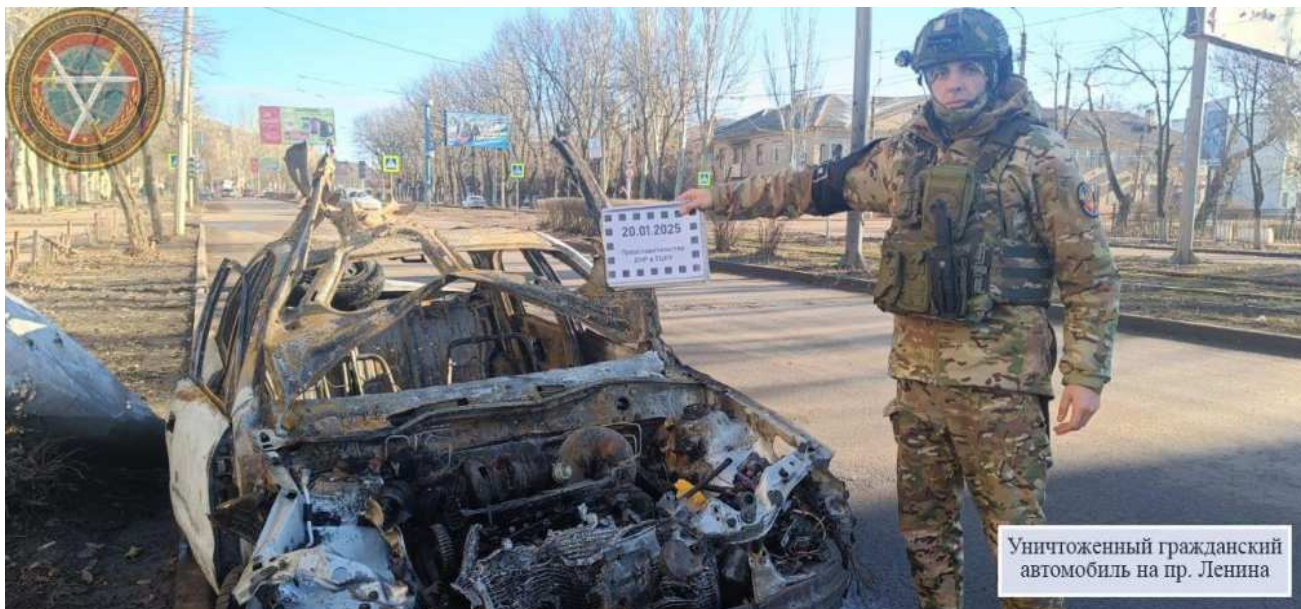
Уничтоженный гражданский автомобиль на пр. Ленина